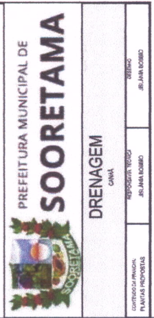
PLANTA BAIXA - DRENAGEM SEM ESCALA