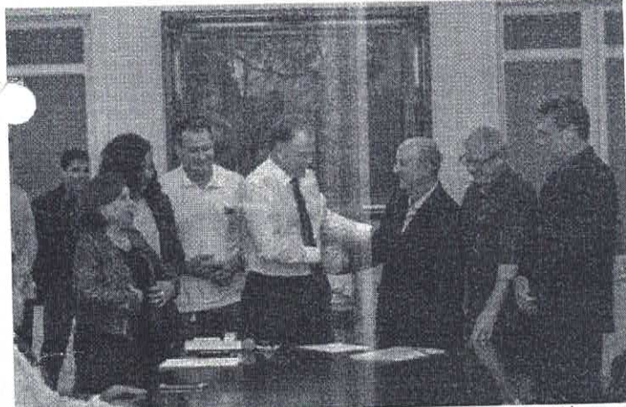
Acordo de Cooperação permite que famílias rurais de baixa renda recebam apoio técnico do Incaper