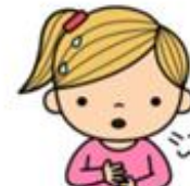
DIFICULDADE PARA RESPIRAR